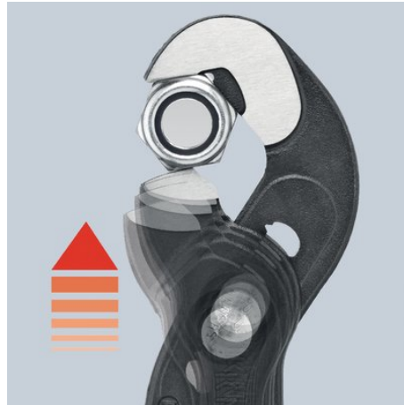
Feinverstellung per Druckknopf: schnell und komfortabel