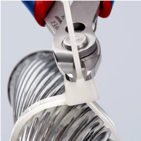
zum bündigen Schneiden, z. B. zum Einkürzen von Kabelbindern