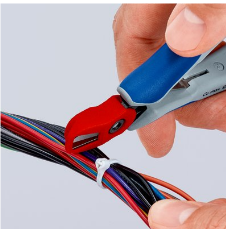
Einfach aufstecken: Der Abschnittfänger ist leicht angebracht und hält zuverlässig am Zangenkopf

Technische Änderungen und Irrtümer vorbehalten