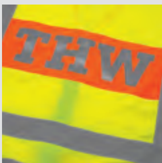
Beispieldruck, individueller Druck möglich