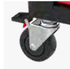
Antistatische Rollen mit Bremse