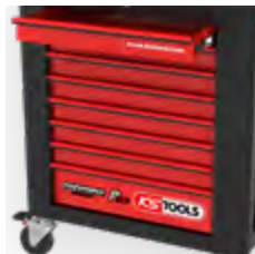
8 Schubladen jeweils bis zu 50 kg belastbar