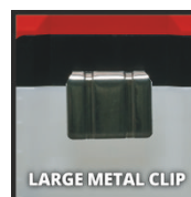
LARGE METAL CLIP