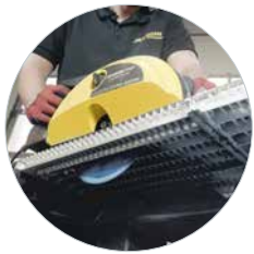
Ideal für Gitterroste mit LBS-Sägeblatt schockresistent Art.: 608295LBS