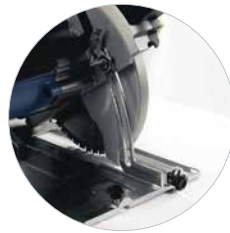
Tiefeneinstellung mit Skalierung