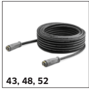
43, 48, 52