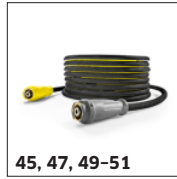
45, 47, 49-51