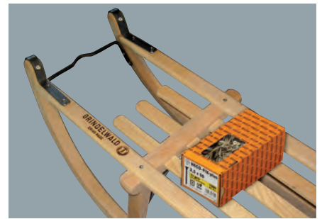
Die ideale Allround-Schraube für viele Anwendungen