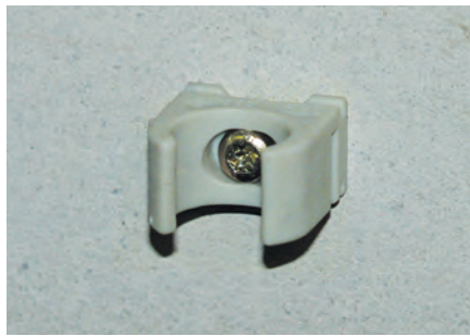
Befestigung auf Beton und Mauerwerk